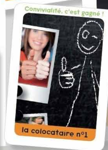
la colocataire n°1